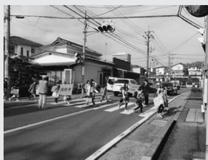
登校児童の見守り活動

散歩中に登校児童を見守ったり、買い物などの外出時にパトロールをしていただくことが主な活動となっています。