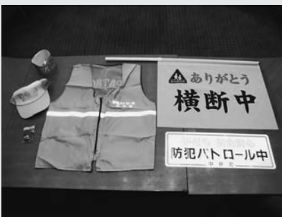
貸与品（腕章・帽子・笛・ベスト旗・マグネットステッカー）