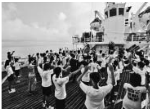
船上での様子(昨年度)

1市4町1村(秦野市、中井町、大井町、松田町、二宮町、清川村)の中学生が、東海大学の海洋調査船「望星丸」に乗船し、2泊3日の日程で船上での活動や、大島・新島での自然体