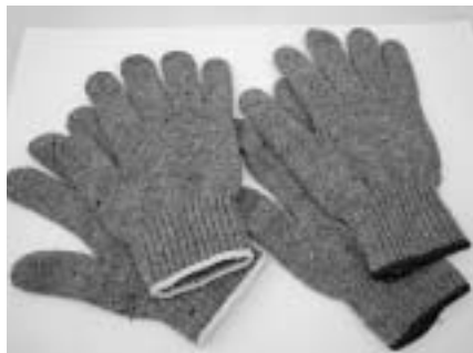
回収した衣類から再生された軍手

その他の衣類として再利用できないものは、機械の油拭きに使うウエスや自動車の断熱材、カーペットの下敷、軍手などに生まれ変わることから、再利用できず廃棄するものはほんのわずかです。