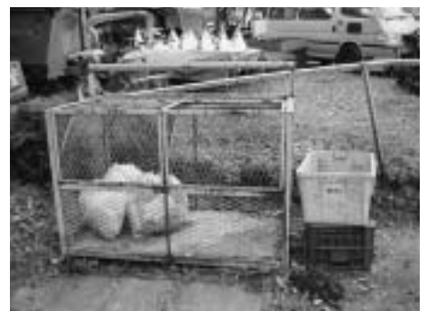
環境経済課環境班 ☎(81)1115