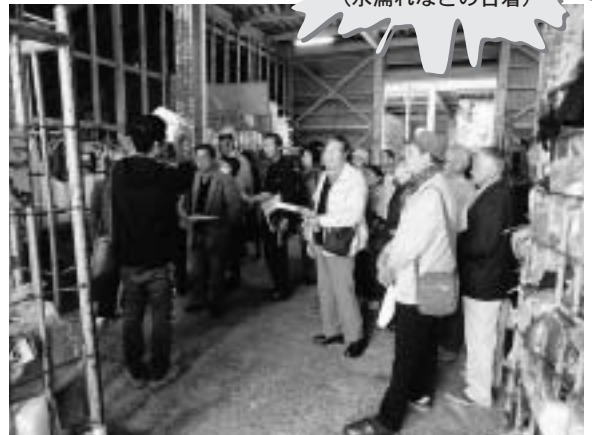
衣類リサイクル工場で説明を受ける参加者