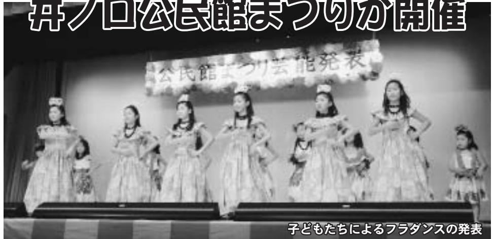
子どもたちによるフラダンスの発表