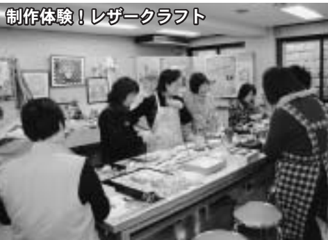
制作体験！レザークラフト