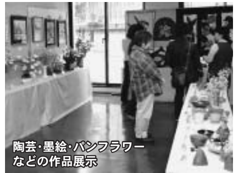
陶芸・墨絵・パンフラワー などの作品展示

2月21日(日)井ノ口公民館で、第12回井ノ口公民館まつりが開催され、公民館で楽しく学んだ各種教室・講座の受講生や活動するサークルらが日ごろの学習と練習の成果を発表しました。 会場には、絵手紙・レザークラフト・書道・俳句・陶芸・墨