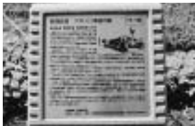
軽便鉄道停車場跡の石碑