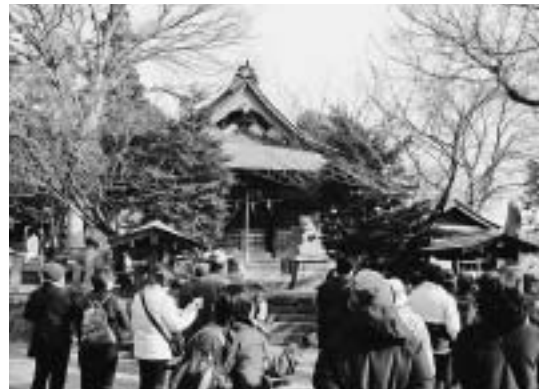
一昨年の様子(菘笠神社)