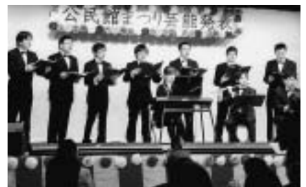
初参加の「管楽練の会&テルモ男声合唱団」

2月22日(日)、井ノ口公民館で、公民館まつりが開催されました。日ごろから同公民館を利用しているサークルによる芸能発表や作品展示、イベントなどが催されました。