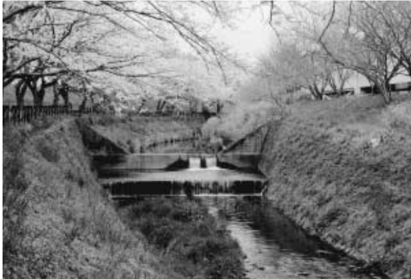
玉置正さんの作品『春の葛川』

Point 桜と菜の花、そして水の流れを取り入れて撮影。撮影時期は平成19年4月。場所はヤオハン二宮店の裏。