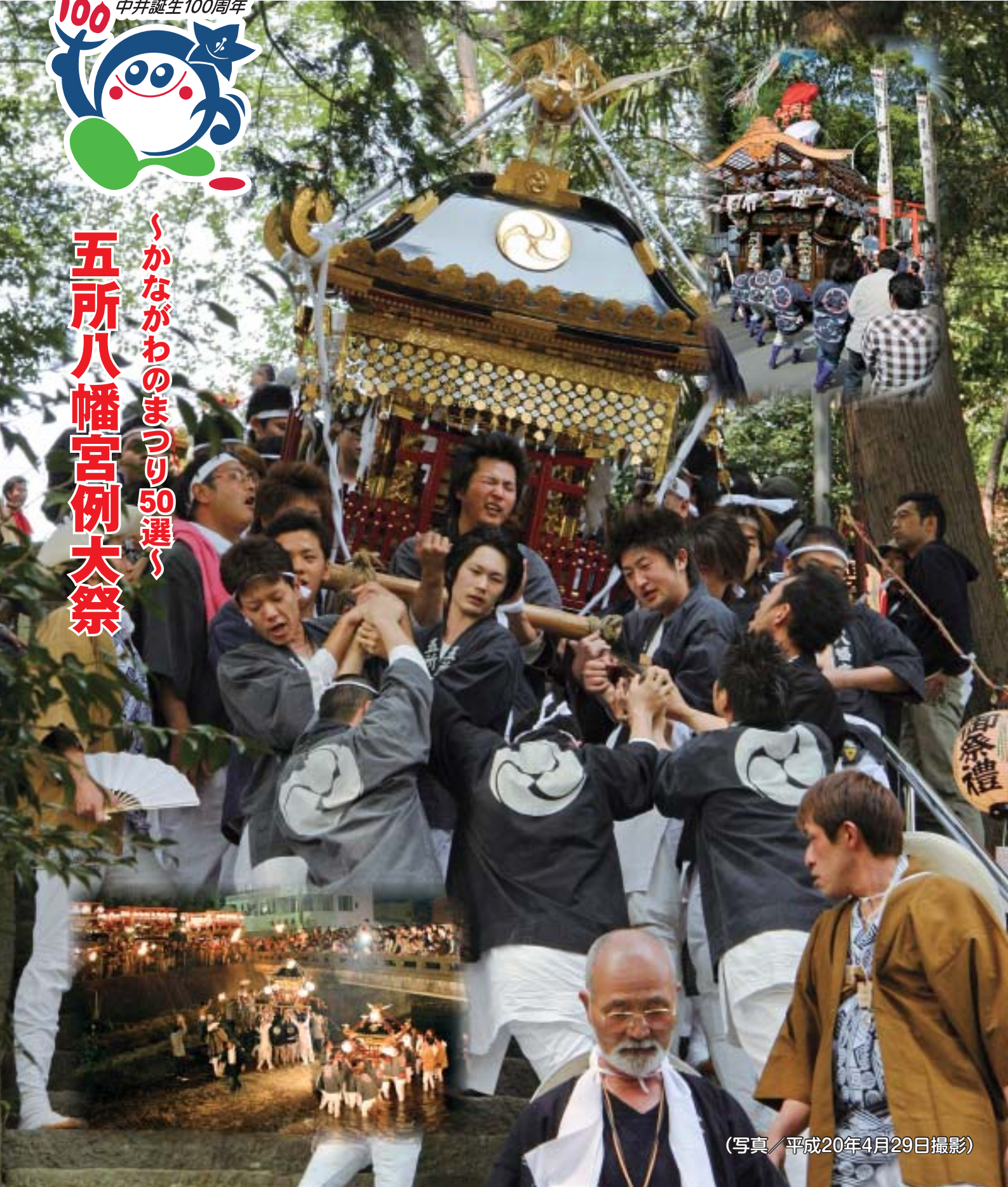
(写真/平成20年4月29日撮影)