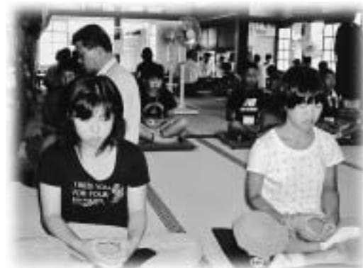
泰翁寺で座禅に挑戦