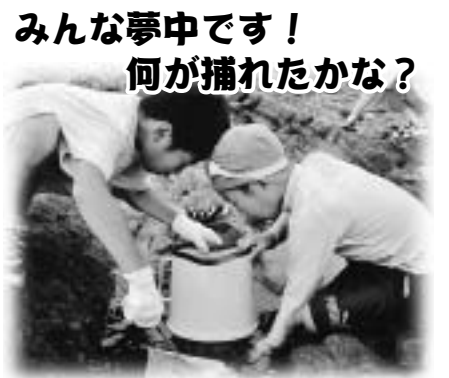
照ヶ崎海岸での磯遊び