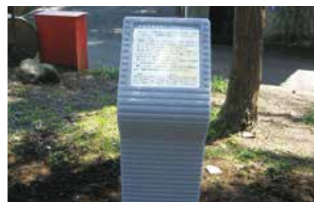
中井の昔話案内板

心地よい里山風景の残る中井町には様々な昔話が言い伝えられています。ルート上の実地の伝承地付近に案内板が設置されています。探してみよう。