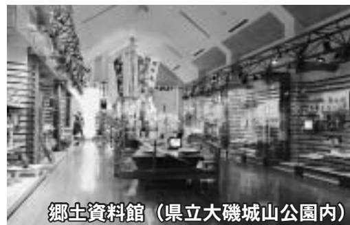
郷土資料館 (県立大磯城山公園内)