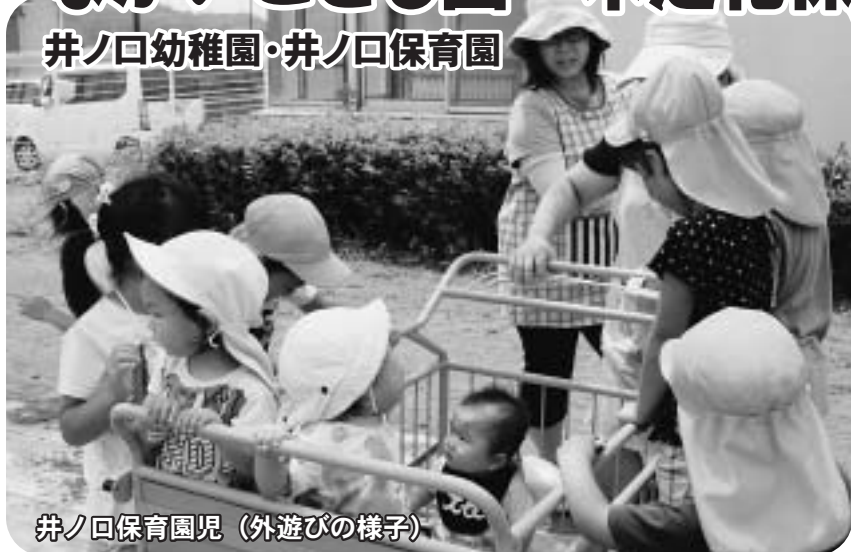
井ノ口保育園児（外遊びの様子）