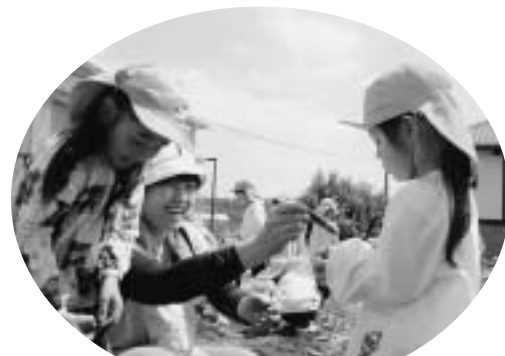
井ノ口幼稚園児（畑での農作物収穫の様子）