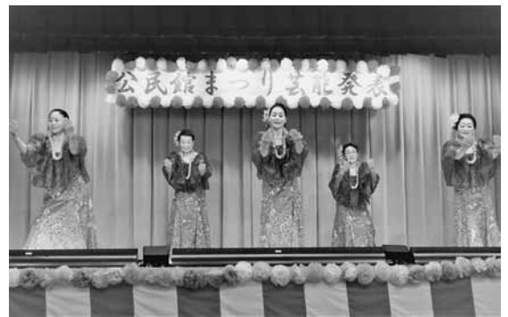
昨年の井ノ口公民館まつり

時 3月13日(水)10時〜11時 場 なかいこども園どんぐり棟園庭および遊戯室