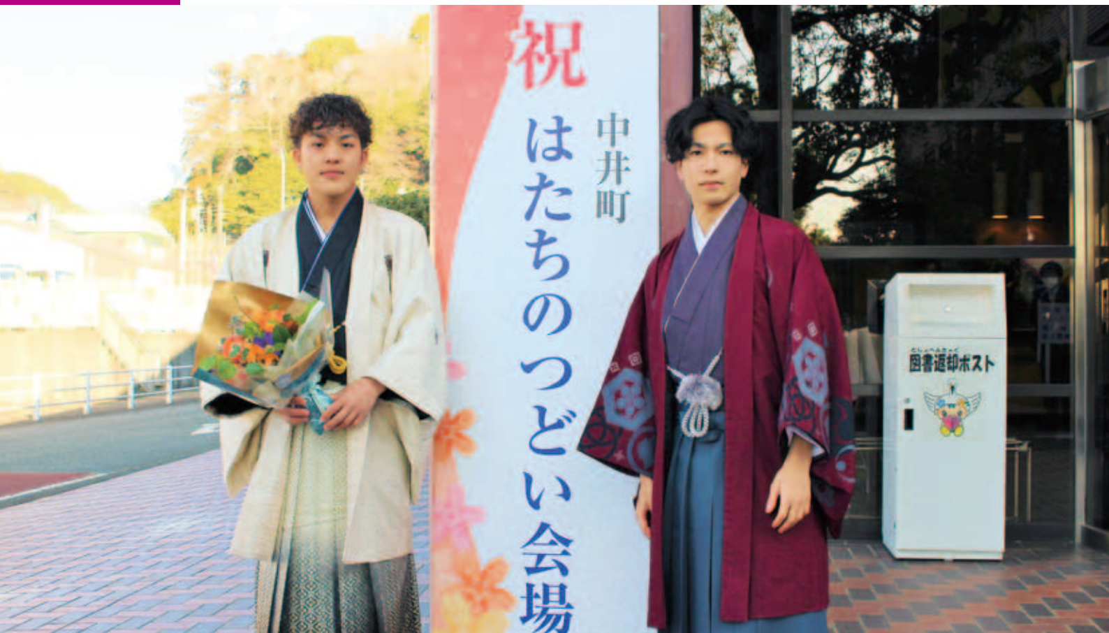
祝 二十歳 特集P2-5 令和6年中井町はたちのつどい