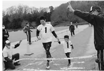
過去の大会の様子