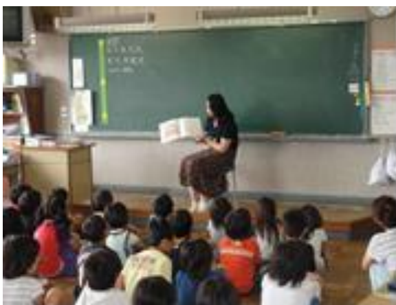
【読み聞かせボランティアによる読み聞かせ（中村小）】