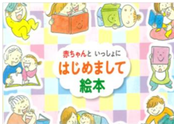
【アドバイスブックレット】