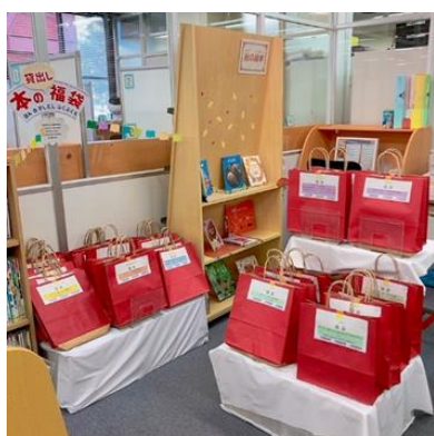
【本のかしだし福袋】