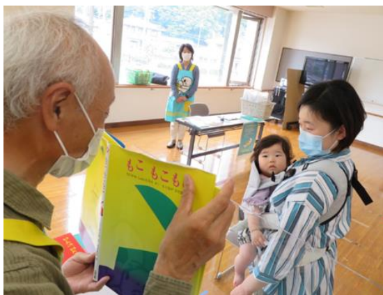
【民生委員による読み聞かせの様子】

子どもの読書活動の一層の推進を図るため、成長に応じて読書に親しみ、楽しめる体験をつくるなど、読書活動が日常習慣となるような取り組みが必要です。また、子どもが自主的な読書活動を習慣づけるには、家庭、学校、地域等の連携した取り組みが求められています。