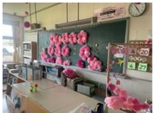
【図書室の様子（井ノ口小）】