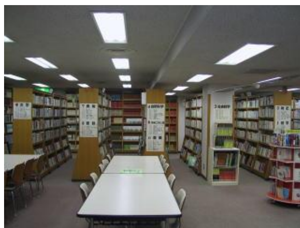
【井ノ口公民館図書室の様子】