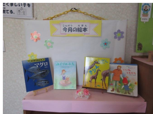
【4・5歳児の月刊誌を紹介する絵本コーナー （こども園）】