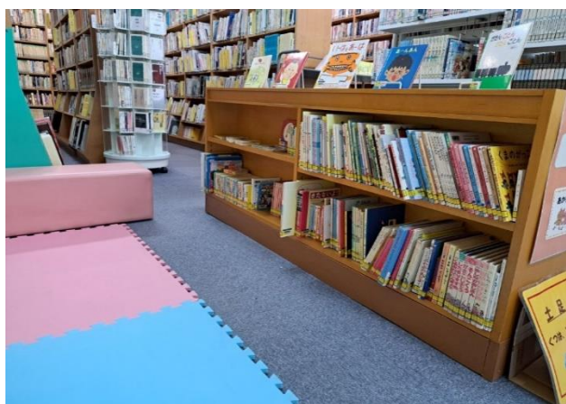
【農村環境改善センター図書室内の様子】