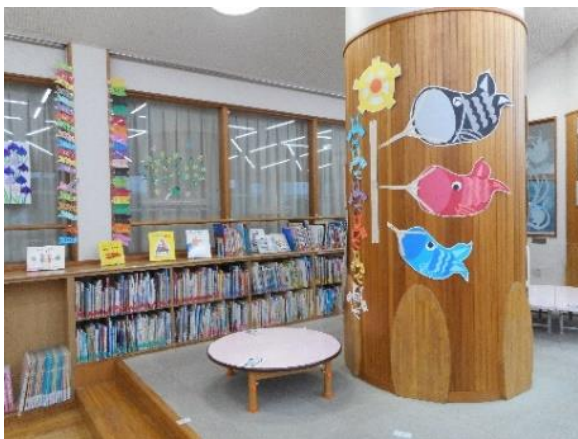
【図書整理ボランティアによる環境整備 （中村小）】