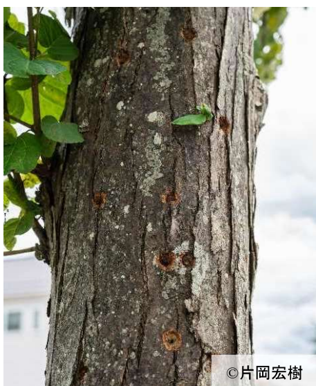
ツヤハダゴマダラカミキリの産卵痕

国内にはゴマダラカミキリ等、同属の在来種4種が分布している。各種とも類似するが、上翅のつけ根の細かい突起の有無等の特徴から識別できる。