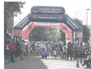
平成25年から開催した湘南シクロクロス大会の様子