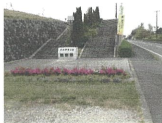
季節の花による園内演出