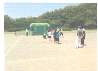
「なかい健康・スポレク祭」への参加