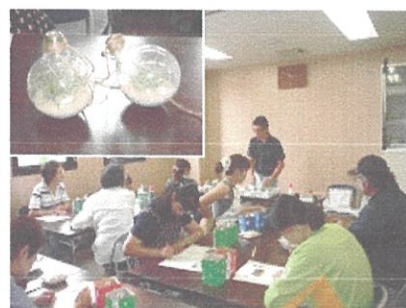
電球を使ったテラリウム製作 (平成 27 年 8 月)