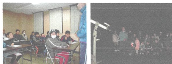
座学(左)と星空観察(右)の風景 (平成 27 年 1 月)

こども達を対象に、野球場会議室で座学を行った後、野球場等で星空を観察し、自然の素晴らしさを伝えます。