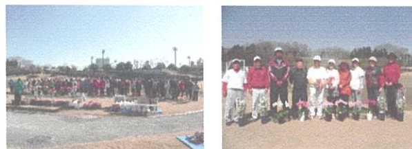
湘南造園カップ開会式(左)入賞者(右)(平成 28 年 3 月)

身近なオープン参加の身近な大会として、多くの利用者に、日頃の成果を発揮して頂きます。