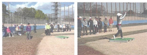
野球場を特設会場としたドラコン・ニアピン大会