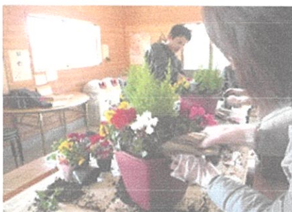
クリスマスの寄せ植え教室 (平成 26 年 12 月)