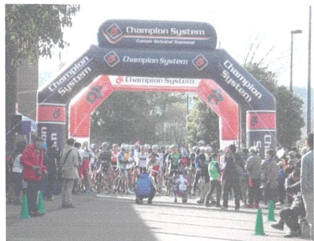
平成 26 年に開催した湘南シクロクロス大会の様子