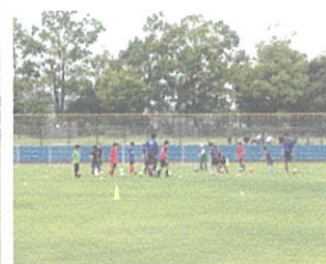
親子サッカー教室(左)と小学生対象サッカー教室(右)