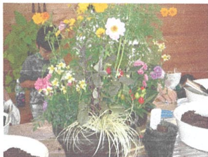
コンテナガーデン教室 (平成 25 年 9 月)

会議室等を利用して、寄せ植え教室、ハンギングバスケット、苔玉づくり、コンテナガーデンなど様々な園芸教室を開催し、地域交流・地域文化の振興に寄与します。