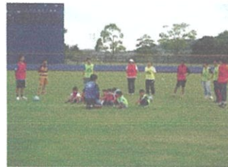
親子サッカー教室

親子サッカー教室等スポーツイベントや熱中症予防対策講座、野球場・多目的広場周辺を利用したフリーマーケット、星空観察会など様々なプログラムを企画・実施し、こどもから高齢者まで幅広い世代の方が楽しめる公園づくりに努め、利用促進を図ります。