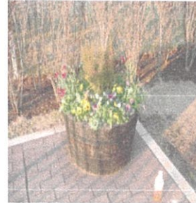
季節の花による園内演出