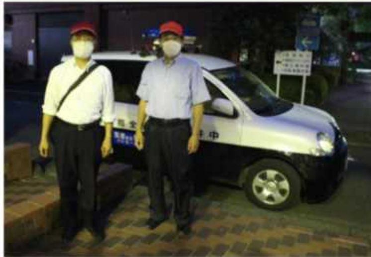
●夜間パトロール(8月3日・12月21日)

今まであった当たり前の日常を取り戻すにはまだまだ時間を要すると思いますが、文化広報でもコロナ禍でできる事業を模索しながら、より一層子ども達に寄り添える指導員になれるよう今後も取り組んでいきます。