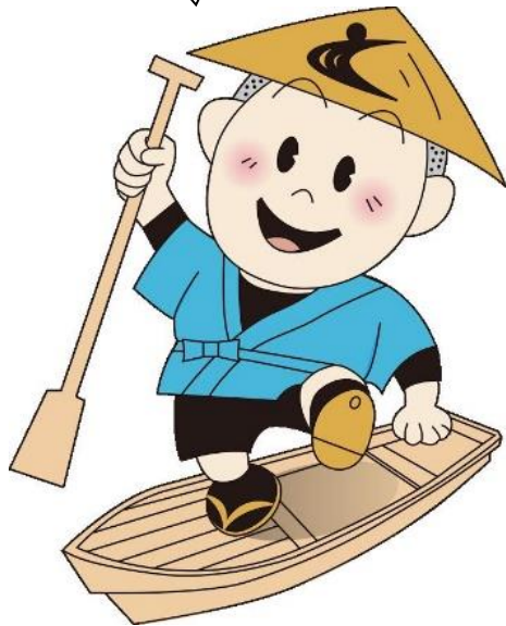
戸沢村キャラクター 「せんだう君」