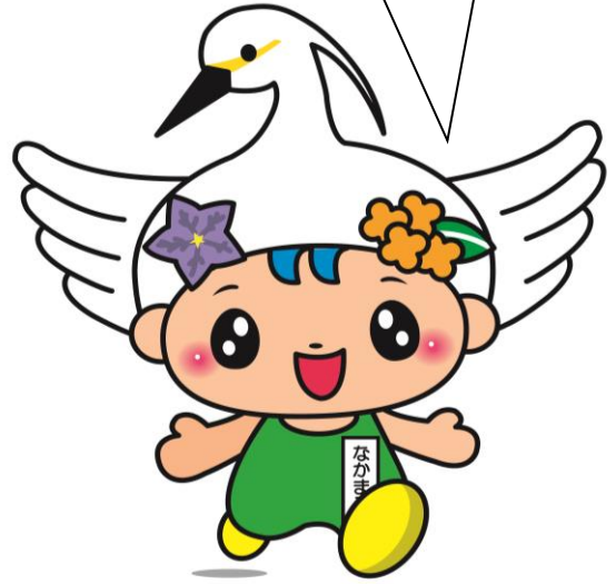
中井町キャラクター 「なかまる」