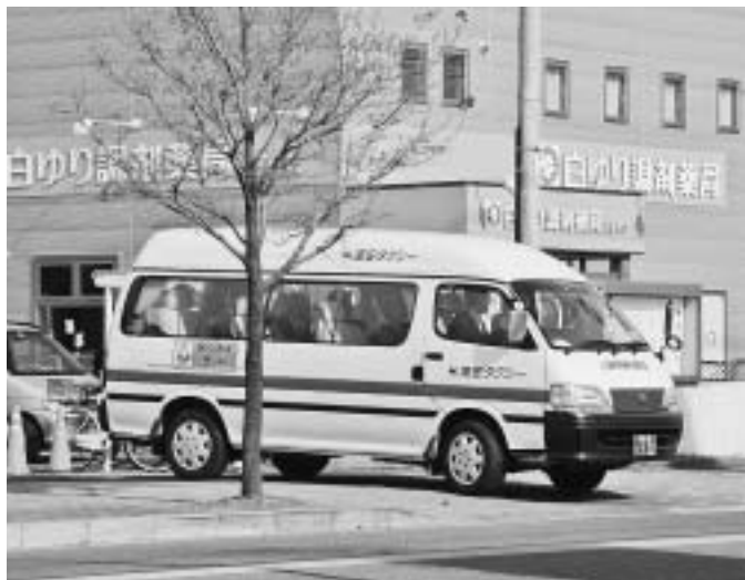
求められる生活の足

本町は通学路の危険箇所が多く、送迎は中学校で七〇％位、また地域によっては百％。時には子どもの友達を乗せるなど、何かあつ