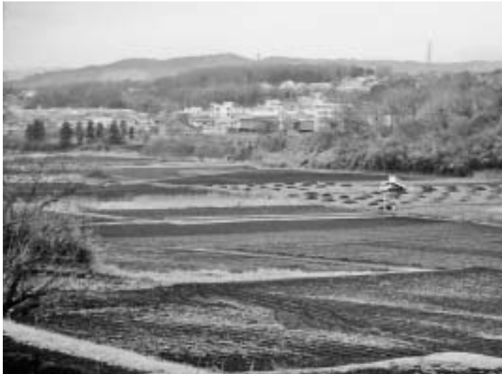
積極的な企業誘致を

そこでインター周辺地域に流通関連企業の進出依頼もあることから、諸問題に対応しながら誘導を図りたい。