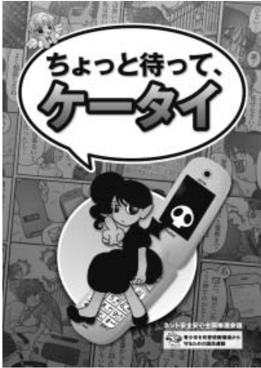
引用：文部科学省、リーフレット

今後も学校と協力して、保護者への啓発、児童・生徒への指導を行い、トラブルや危険防止に努めていく。