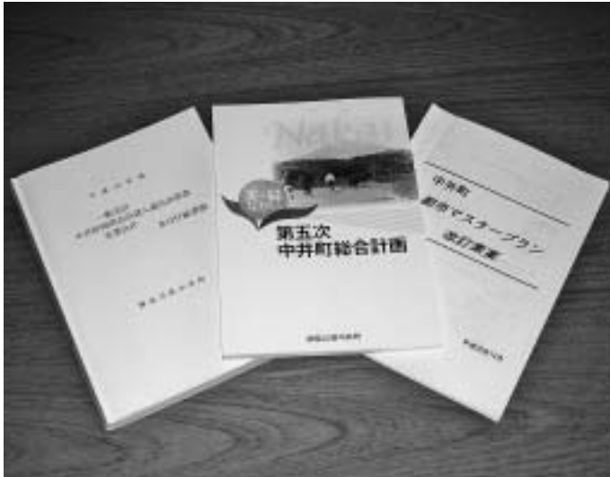
安全安心のまちづくりの推進は