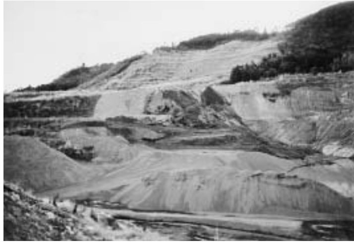
心配される埋め戻し

町においては、昭和四〇年代より企業進出がみられ、同時進行するように砂利採取が始まった。現在では砂利採取跡地によっては埋め戻しが行われている。