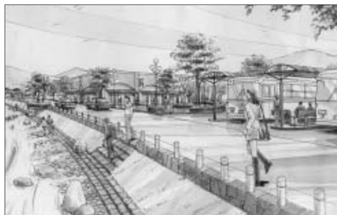
平成9年策定 都市マスタープラン役場周辺イメージ図