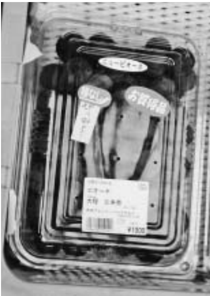
栽培履歴がわかる取り組みを

日本の食料自給率は四〇％程度と低く輸入に依存している。輸入食品に残留農薬や有害物質、国内では産地偽装や汚染米流通等が社会問題となっている。