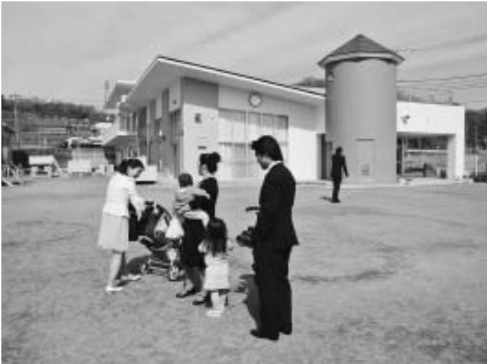
幼保一体化が検討されている井ノ口保育園

についての取り扱いに差異があるのは住民に混乱を招くため適当ではない」「経済対策としての一定の効果はあるものと思われるが、国民生活に貢献する抜本的な経済対策を望む」など、報道のアンケートに答えた。今後も有効活用を求める。