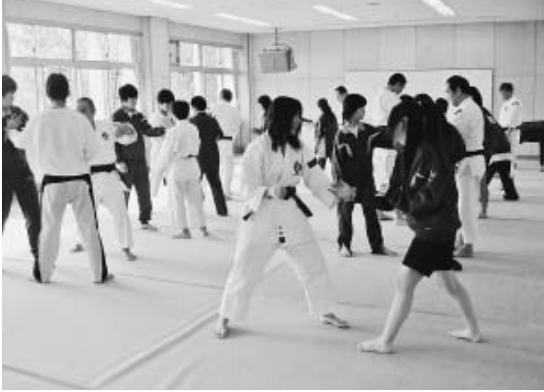
中学生にも医療費の助成拡大を