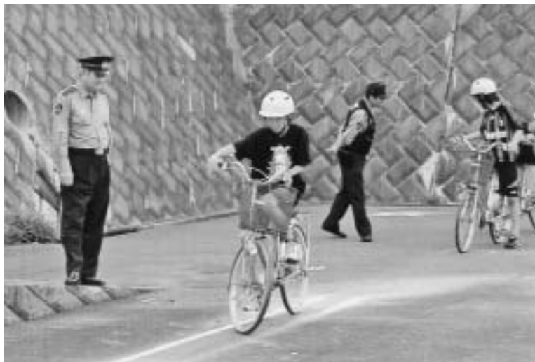
自転車も交通ルールを守って

を対象とした交通安全教室では、自転車の安全な乗り方についての講義及び実技指導を行っており、講義終了後、神奈川県警察発行の自転車安全運転証を交付している。