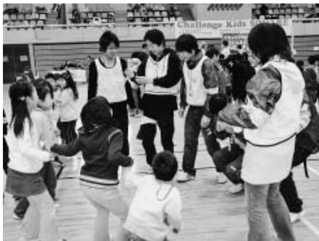
子どもと密着して活動するジュニアリーダー

ひとりだちするにはどのような研鑽 けんざん をするかプログラムが重要です。どのようにお考えですか。③ 経費について 会員の育成や活動のために経費が必要です。今後どのように計画されるか。お尋ねします。