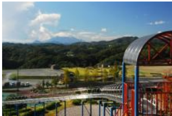
◆ ローラー滑り台（延長101.7m）◆