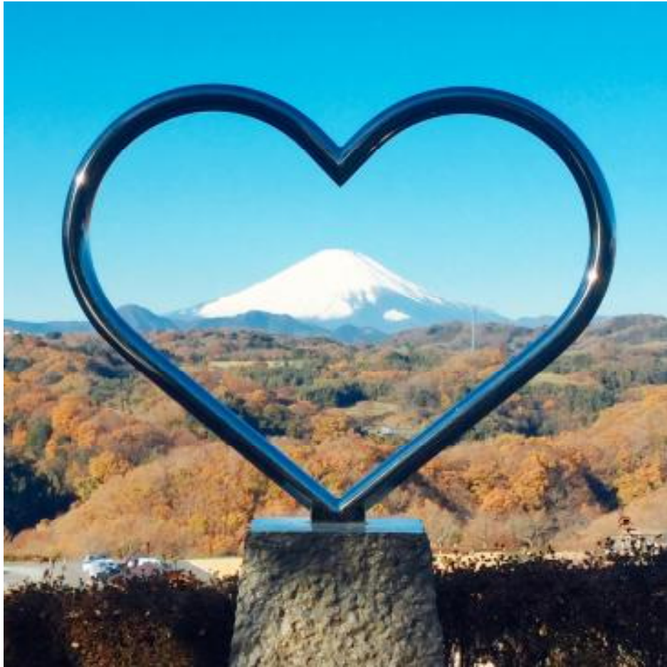
◆ 中井中央公園ハートの丘 ◆