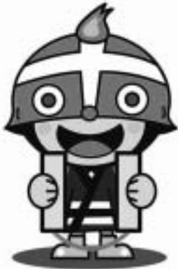
ファイヤーけしまるくん

火災はあなたの大切な命、財産をすべて奪います。7つのポイントをしっかりチェックしましょう！