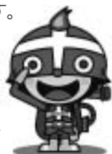
小田原市消防マスコットキャラクター ファイヤーけしまる