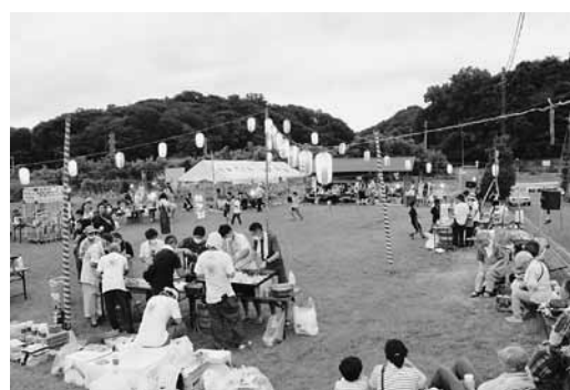
▲遠藤自治会納涼祭

でも「一人の方が気楽」という方も大勢います。世の中にはいろいろな方がいることを認め合い、お互いに無理のない関係を築きましょう。