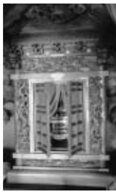
境原自治会館の地蔵菩薩像

仏像は通常お寺に祀られていますが、しかし、中井町では半数以上の自治会館に仏像が保存されています。境原自治会館には地蔵菩薩像(釈迦死後の仏がない間人々を救う、悟り最高位の如来に至らない修行中の仏さま)があります。仏像は高さ六十三センチほどですが、この仏像が収められている厨子(ずし)は、総檜(けやき)造り、正面両脇は上り竜・下り竜の彫刻と獅子頭・象頭を配し、欄間には松に鷹、床の下正面は波模様彫刻とまるで神輿のように凝っています。