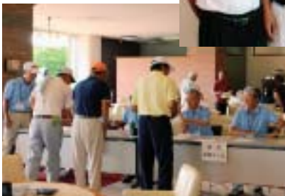
◀プレーが終了した参加者を笑顔で迎える大会主催者のゴルフ協会役員