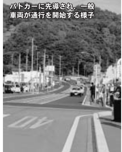
パトカーに先導され、一般車両が通行を開始する様子