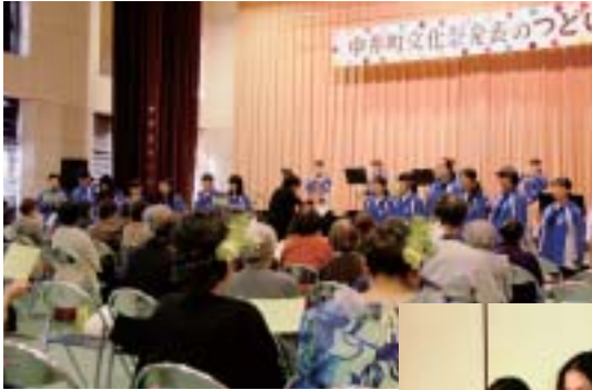
(上) 中井中学校吹奏楽部の演奏中、観客と合唱する場面もあり一体感のあるステージに。

また、併せて短歌俳句大会や読書の日のつどいの表彰式、郷土資料館講演会、里山なかい市も開催されました。