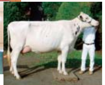
(下) 受賞した乳牛 【名号】 エメラルドレイク ソータモブラクストン