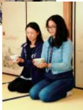
(右) 茶道点前では、中井町に滞在していた留学生(写真右)が、日本の文化とお茶を味わっていました。