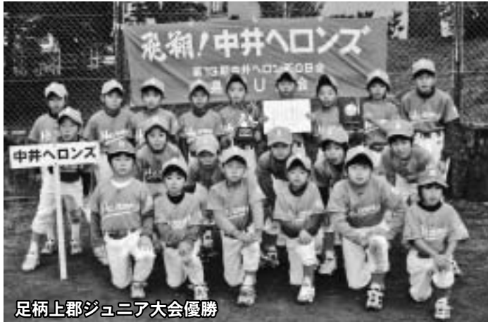
足柄上郡ジュニア大会優勝