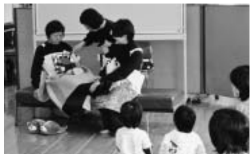
▲むし歯予防のエプロンシアター

たまごの会は、町の幼児歯科健診の受診者を対象に、平成10年度よりむし歯予防のエプロンシアターを上演しています。この活動が評価され、今回の表彰となりました。今後も、町民の皆さんの歯の健康維持に一層のご協力をお願いします。