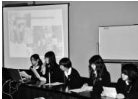
▲研究の成果を発表する中井中2年生の生徒たち

また、中高生による「ごみゼロチャレンジ」成果発表では、中井中学校2年生の生徒5名が、中井町のごみ不法投棄の現状などを、実際に現場を見に行ったようすや、町内の清掃活動に参加した体験を通じて、不法投棄撲滅を訴え、もっとたくさんの人たちに、「ごみゼロ」をPRできるような活動をしていきたいと発表しました。