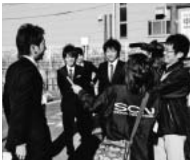
▲中井町成人のつどいででの収録風景