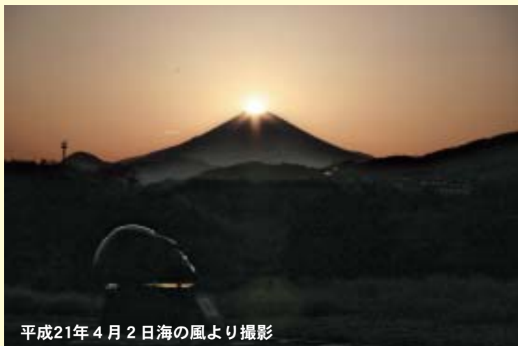
平成21年4月2日海の風より撮影

富士山頂から太陽が昇る瞬間と沈む瞬間に、富士山と太陽が重なり富士山がダイヤモンドのように輝く現象のことを「ダイヤモンド富士」といいます。富士山と光輝く太陽が織りなす光景は、まさに自然の芸術といえます。