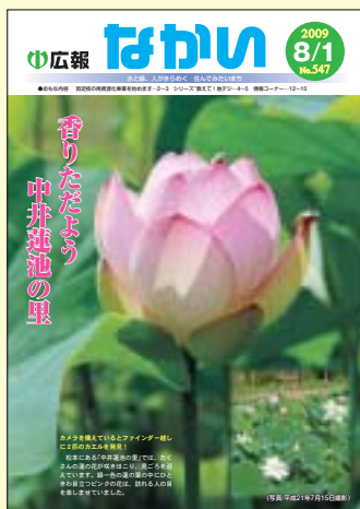
▲受賞作品【写真・組み写真】最優秀