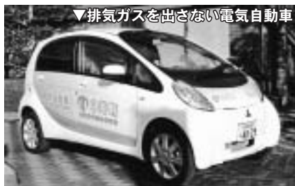
▼排気ガスを出さない電気自動車

町では、地球温暖化防止に向けた取り組みとして、環境性能に優れた電気自動車の普及を推進していきます。このため、これにかかる軽自動車税の減免措置を平成22年度より実施します。