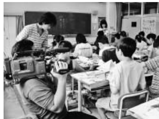
▲学校行事なども取材に伺います

地元湘南エリアの情報を中心に、地域に根差した取材活動および番組制作を行っています。今後は、近隣の市・町の情報とともに中井町のイベント情報等も、既存の番組の中で紹介していきます。