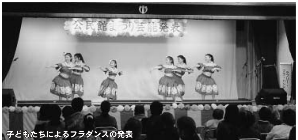
子どもたちによるフラダンスの発表

絵・パンフラワーなどの作品が展 示されたほか、茶道点前や模擬店 も設けられ、会場を訪れた方は、 繊細に作られた作品に見入ってい ました。また、2階講堂では、芸 能発表が行われ、ステージ上では 楽器の演奏や、フラダンスなどが 披露されました。