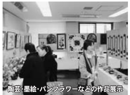
陶芸・墨絵・パンフラワーなどの作品展示

絵・パンフラワーなどの作品が展 示されたほか、茶道点前や模擬店 も設けられ、会場を訪れた方は、 繊細に作られた作品に見入ってい ました。また、2階講堂では、芸 能発表が行われ、ステージ上では 楽器の演奏や、フラダンスなどが 披露されました。