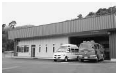
新しくなった中井分遣所