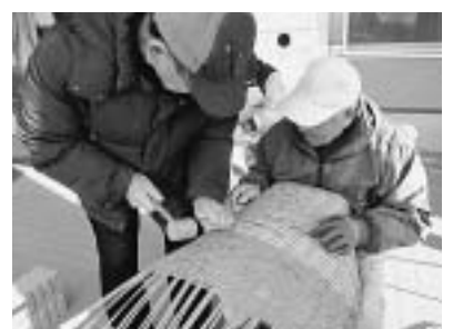
中井町細工クラブの活動の様子