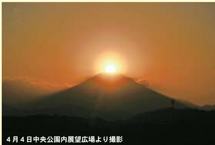
4月4日中央公園内展望広場より撮影

富士山頂に太陽が沈む際に宝石のように輝く「ダイヤモンド富士」。 4月4日(月)、中央公園内展望広場から観察することができました。