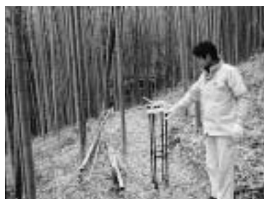
▲測定の様子（竹林内）

測定結果は次ページの表のとおり、多少のバラつきはあるものの、すべての地点で町の基準値である0.19μSv/hを大きく下回りました。