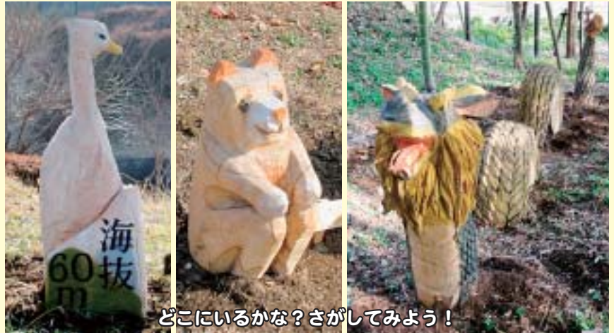
どこにいるかな?さがしてみよう!

町内にも、小・中学校や中央公園、巖島湿生公園をはじめとする各所に、町の鳥である「しらさぎ」や「龍」等のアート作品およそ34点が設置され、いつでも誰でも自由に鑑賞することができます。