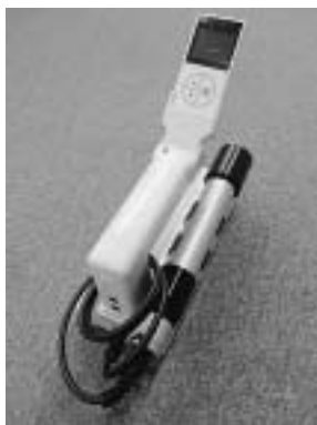
▲町で購入した測定機器

測定機器は、エネルギー補償型シンチレーションサーベイメータ（富士電機株製NH710B1）を使用しています。