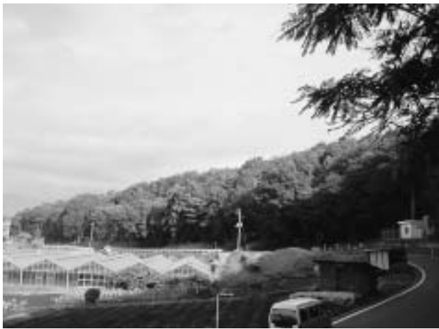
平成24年度整備箇所（井ノ口地区）

地域の貴重な財産である森林の整備について、皆さんのご理解・ご協力をお願いします。