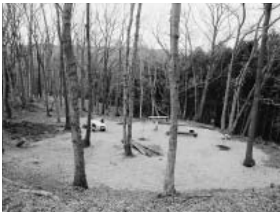
中井町里山倶楽部により整備された森林

なお、昨年、ボランティア団体「中井町里山倶楽部」が立ち上がり、比奈窪地区の森林で里地里山の風景を守るため活動しています。興味のある方は、足柄上商工会中井町里山倶楽部事務局【☎（03）3211-8303】までお問い合わせください。