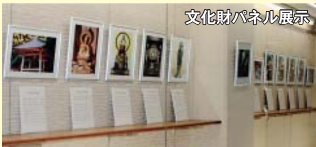
文化財パネル展示