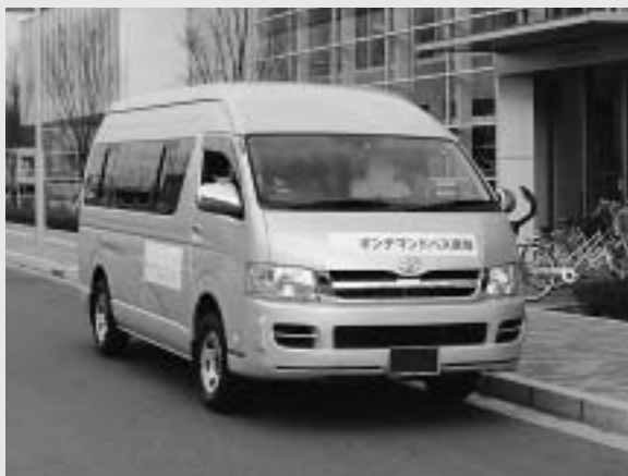
13人乗り(運転手1人)のワンボックス型車両2台で運行します。