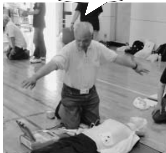
防災リーダー普通救命講習会の様子