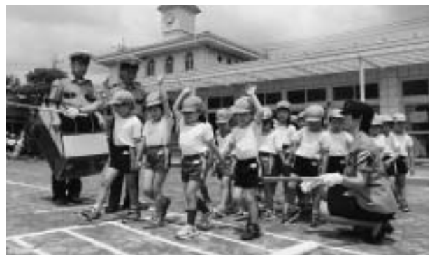
木之花保育園で横断歩道を渡る練習をする園児

6月に、各小学校、なかいこども園、木之花保育園で町の交通指導隊による交通安全教室が開催されました。 園児はリズム遊びを取り入れて楽しく交通ルールを学び、横断歩道を渡る練習などを行いました。 また、小学校1・2年生は交差点の渡り方、3・6年生は自転車の安全な乗り方などを教わりました。 夏休み中は、子どもたちだけで遊びに行く機会が増えます。事故のないよう交通ルールをきちんと守って、楽しく過ごしましょう。