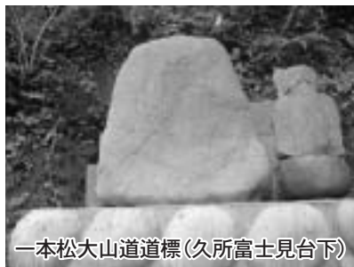
一本松大山道道標(久所富士見台下)

ところで、大山道は、関八州の守り神に ならんという徳川家康 の遺言により、元和3 (1617)年、その遺 体の一部を駿河(静岡 県)の久能山から櫃 (ふたつきの箱)で日 光東照宮に改葬する際 に整備された御尊櫃御 成道(ごそんひつおな りみち)と関連がある ようです。というのも、