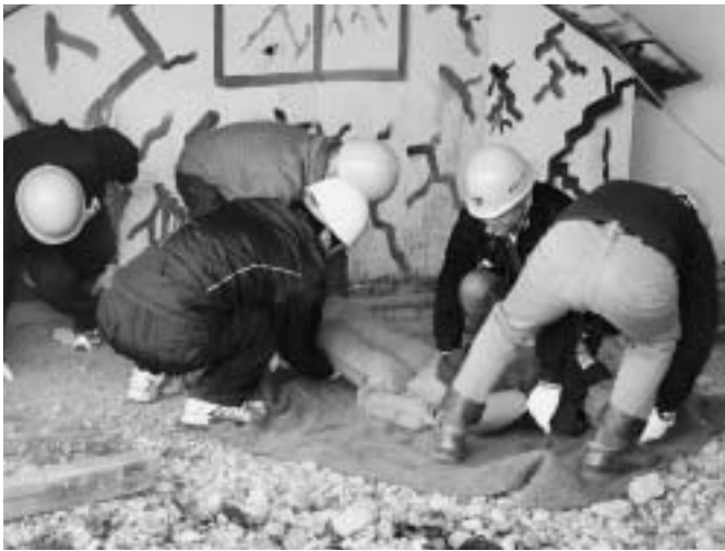
倒壊家屋からの救出訓練の様子 (中井町自主防災会防災リーダー研修会)

被害の大きかった地域では、警察や消防本部による活動を待たず、地域住民や消防団が壊れた住宅の下敷きになった人の救出や高齢者の避難を支援しました。住民たちは古くからの付き合いがあり、それぞれの住宅の家族構成などを把握していたことから、スムーズな救出ができたため、大規模な災害の中で犠牲者を出さずに済みました。