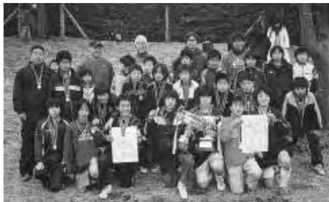
2/19(日)第5回いこいの村あしがら杯優勝