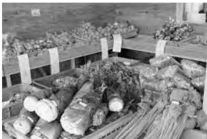
野菜直販コーナー