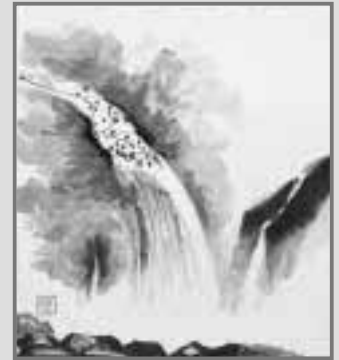
題名「滝」 小清水宗二(宮向)