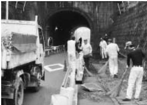
新学期を前に、中学生の通学路にもなっている中井隧道のボランティア清掃を行いました。