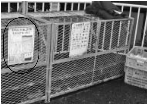
井ノ口地区のごみ収集所と掲示板に、児童手作りの「ごみ減量化啓発ポスター」を掲示しました。

日ごろから町民の皆さんには、ご家庭や地域で環境保全に取り組んでいただいています。資源ごみの分別収集や町内一斉清掃への参加などもその一つです。上記の生ごみ減量化容器(コンポスター、電動式生ごみ処理機)による生ごみの処理も、生ごみの有効活用やごみの減量化手段として、ご家庭でできる環境保全の取り組みの一つです。 ここでは、3月に町内で行われた環境保全の3つの取り組みを紹介します。