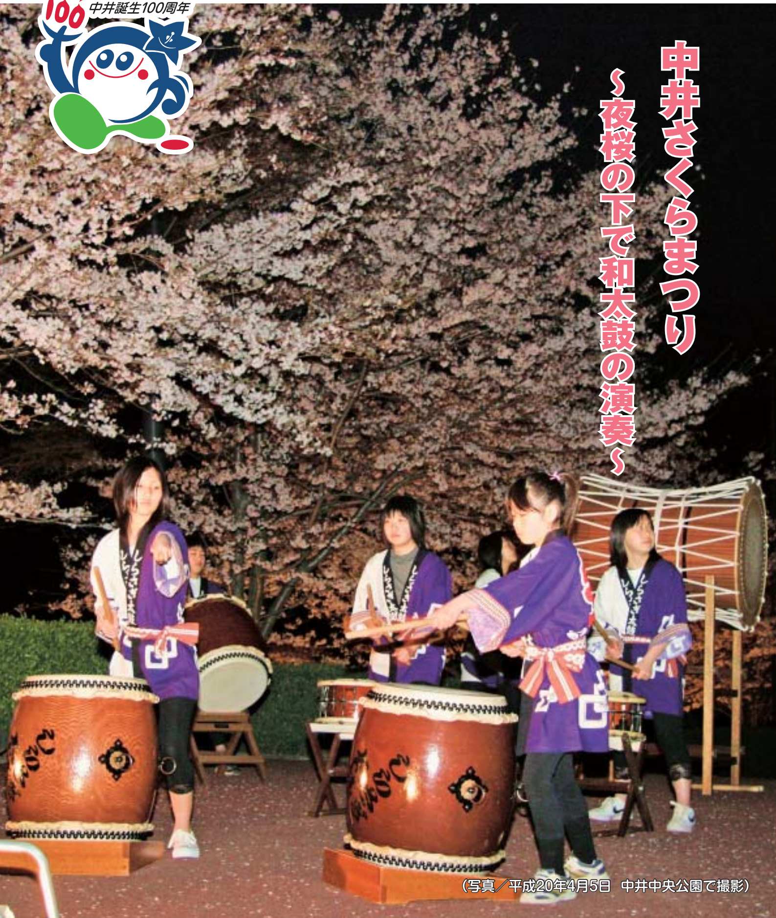
(写真/平成20年4月5日 中井中央公園で撮影)