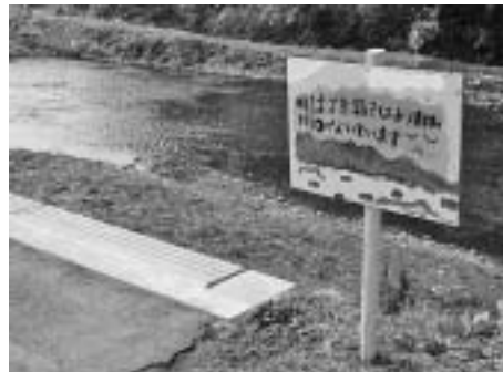
「中村川クリーン作戦」中村川からごみをなくし、川をきれいにしようと、ごみ拾いやPR看板の設置、中央公園でのチラシ配布などを行いました。