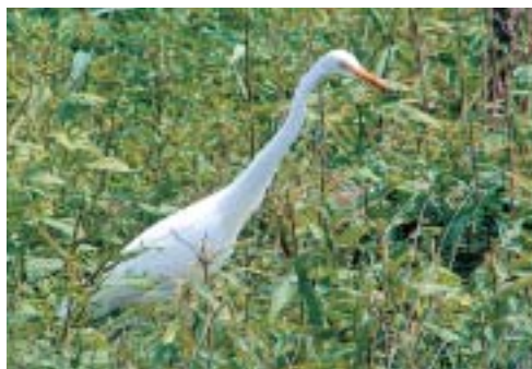
「採餌中のチュウサギ」 坂本勝嘉さん（中井町）