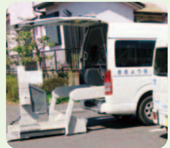
高齢者移送サービス