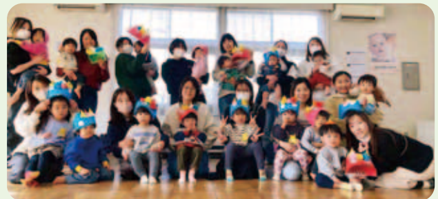
未就園児と親の遊ぶ会