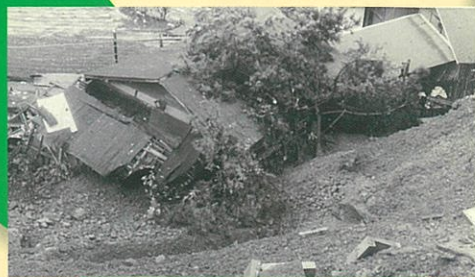
▲昭和47年に発生した 土砂崩れ(久所地区)

災害はいつどこで発生してもおかしくないということを認識し、日ごろから災害に備えましょう。